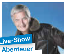
Live-Show Abenteuer Weltumrundung