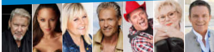
Johnny Logan, Jasmin Wagner/Blümchen, Gaby Baginsky, Olaf Berger, Markus Becker, Peggy March und Stefan Mross