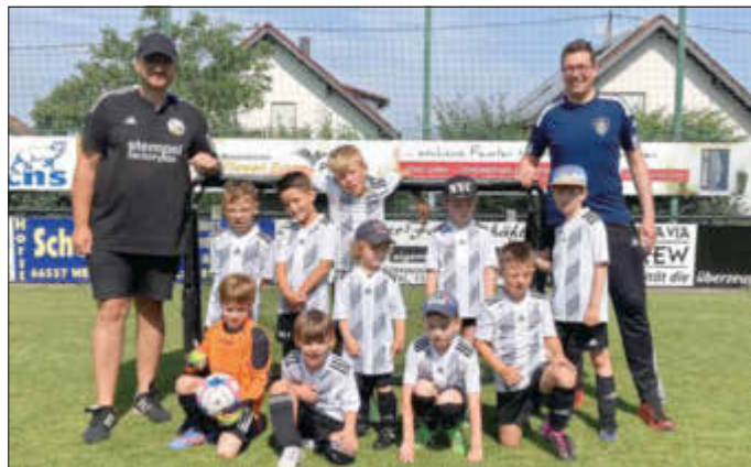
Unsere Trainer mit den Kids.

Bei strahlendem Sonnenschein hatte unsere G-Jugend am Jugendturnier der SG Hirzweiler/Welschbach/Stennweiler teilgenommen. Wir reisten mit zwei Teams an. Das gut organisierte Turnier auf der schönen und gepflegten Naturrasenanlage in Stennweiler nahm schnell Fahrt auf. Bereits um 9 Uhr startete Team 1 gegen das Team des Gastgebers. Im weiteren Turnierverlauf spielte man zudem gegen Urweiler, Gronig, Illingen und den späteren Turniersieger der ersten Turnierrunde. Hier belegte Team 1 gegen sehr starke Gegner einen guten fünften Platz. Alle Kinder kamen zu gleichen Spielanteilen und hatten viel Freude und Spaß bei den Spielen und beim bunten Treiben rund um die Hüpfburg.