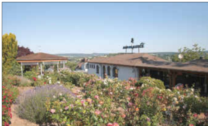
Gaststätte, Pavillon und schattige Terrasse inmitten von Rosen aller Couleur