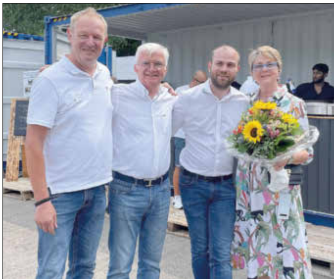
Familie Schneider heute

Quelle: Merchweiler Heimatblätter, Jahrgang 1994, Seiten 97 bis 101 Fotos: Patrick Weydmann und Heimatblätter, Jahrgang 1994, Seiten 97 bis 99 und Firma Monti GmbH & Co. KG