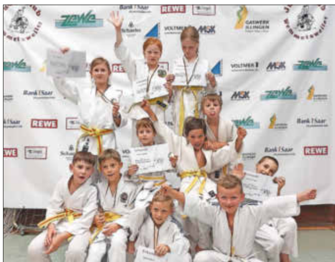
Die U11-Mannschaft des Judo-Clubs Wemmetsweiler

Das Turnier ehrt Ruprecht Drouet, Gründer des Judo-Clubs Wemmetsweiler e.V. im Jahr 1950. Der JCW gehört zu den ältesten Judo-Vereinen des Saarlandes.