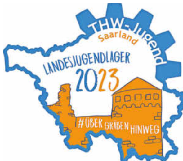
Das Logo zum Landesjugendlager 2023 – gestaltet von Hannah Riehm, OV-Illingen

Weitere Informationen werden unter "ov-illingen.thw.de" sowie "saarland.thw-jugend.de" veröffentlicht.