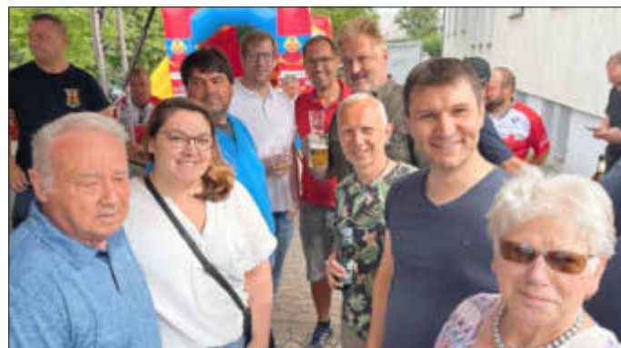
Beim Tag der Feuerwehr