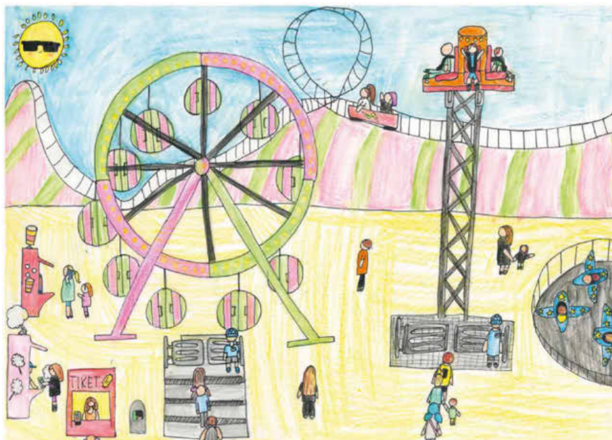
1. Platz: Margaryta Lesnykh, 9 Jahre alt

Der gesamte Malwettbewerb war wieder eine tolle Sache und ein großer Erfolg.