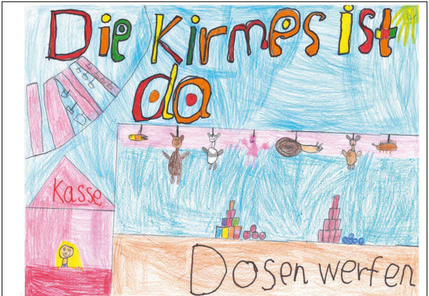
2. Platz: Luise Schneider, 8 Jahre alt