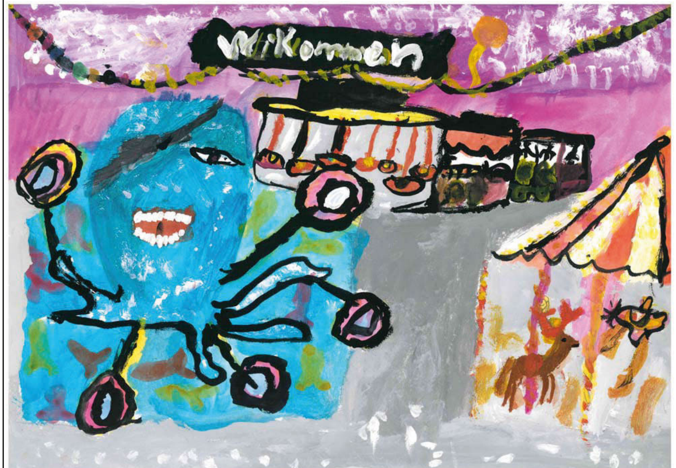
3. Platz: Onora Dormeyer, 10 Jahre alt