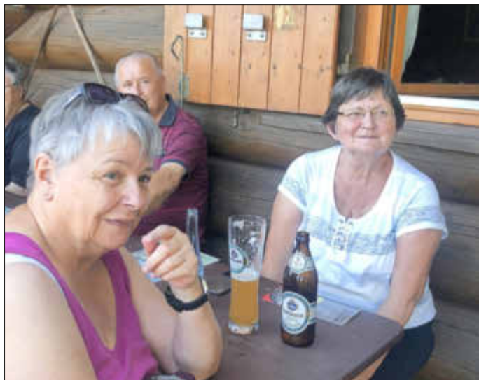
Verdiente Rast auf der Hochwaldalm