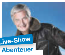
Live-Show Abenteuer Weltumrundung