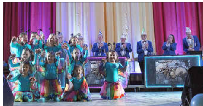
Die Mini-Showtanzgruppe und unser Elferrat bei der Kappensitzung 2023

Karten für die Kinder- und Jugendsitzung: An der Tageskasse. www.kikaju.de