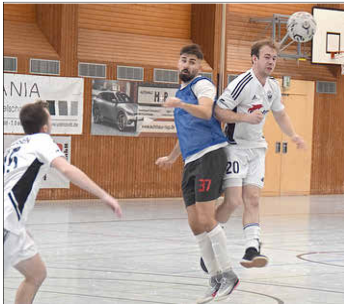
Kopfballduell gegen Eppelborn.