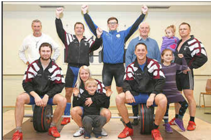
Eine Aufnahme aus dem Jahr 2014: Die Herosfamilie freut sich über den Finalsieg und Aufstieg in die Regionalliga Südwest.

Auf guten Gewichthebersport dürfen sich die Besucher aber trotz der mangelnden Chancengleichheit freuen. Denn beide Teams werden bestrebt sein, in ihrer jeweiligen Situation noch mehr an Boden gutzumachen.