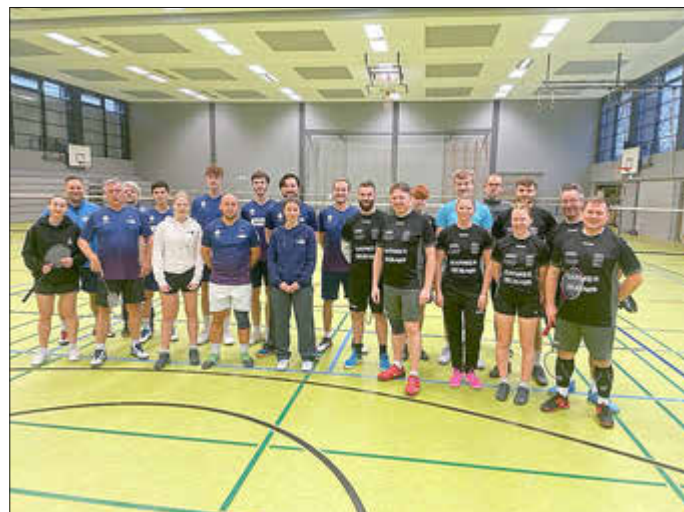
Erste und Zweite Mannschaft in Saarbrücken