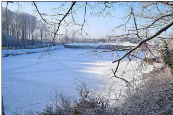
Haldy mit Schnee von gestern

Mittwoch, 31. Januar, 19 Uhr, Haldy, gegen SV Höchen Samstag, 3. Februar, gegen A-Jugend Merchweiler Donnerstag, 8. Februar, gegen U17 Hertha Wiesbach Mittwoch, 14. Februar, gegen SV Humes Sonntag, 18. Februar, 15 Uhr, beim SV Bliesen Erstes Punktspiel: Sonntag, 25. Februar, 14.30 Uhr in Göttelborn