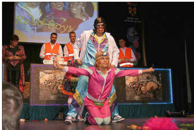
2024 wieder dabei: Die Revo Boys, hier 2020 bei der Ki-Ka-Ju, damals noch im Vereinshaus.