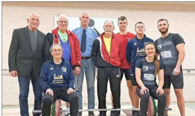
Gruppenaufnahme mit Vertretern beider Vereine

Für das Saisonfinale mit der TSG Kaiserslautern an diesem Samstag (16. März, 18 Uhr Sporthalle Wemmetsweiler) ist also angerichtet. Nach Papierform gilt das Team der Pfälzer, die nach ihrer Niederlage gegen Mainz-Weisenau (131 zu 203 Relativpunkte) hinter den kommenden Gegner Wemmetsweiler zurückgerutscht sind, als Favorit. Dennoch glauben die Verantwortlichen von Heros an eine realistische Chance und damit an einen versöhnlichen sechsten Rang im finalen Classement der Oberligasaison 2023/24.