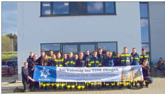
Die Helferinnen und Helfer des THW Illingen freuen sich auf zahlreiche Gäste beim „Tag der offenen Tür“

Das Illinger THW freut sich, zahlreichen Besuchern einen schönen Feiertag bereiten zu können.