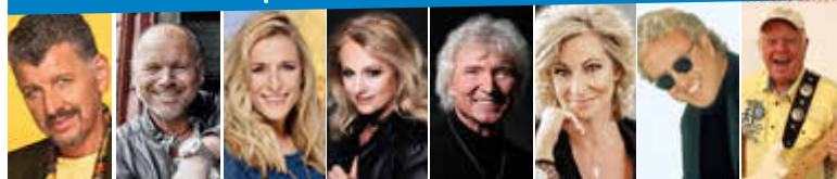
Semino Rossi, Olaf Henning, Stefanie Hertel, Nicole, Peter Orloff, Claudia Jung, Bernie Paul und Graham Bonney

Weitere Infos unter: www.schlager-kanaren.de