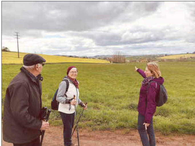
(Weit reicht der Blick vom Wetschhauser Hof über die blühenden Felder)