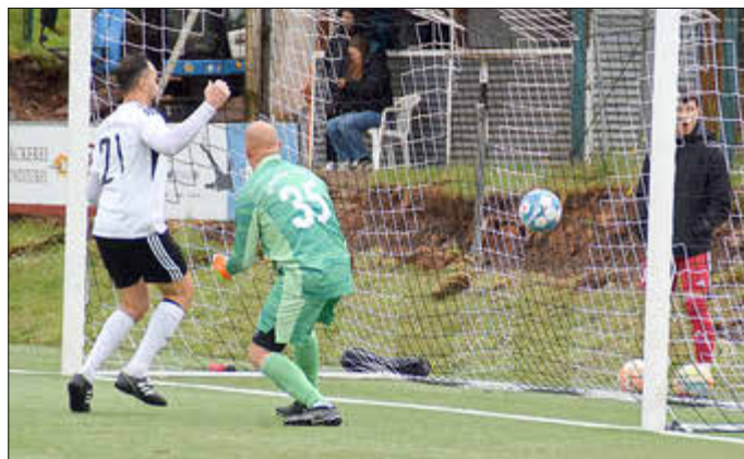
Leder durchgerutscht: Der Ausgleich.

SV Merchweiler 2- SG Marpingen/Urexweiler 2: 1:1 (0:0)