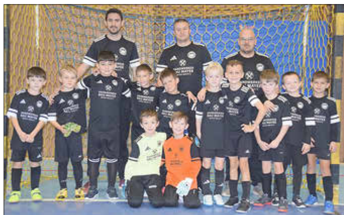
Unsere F-Jugend in neuen Trikots.