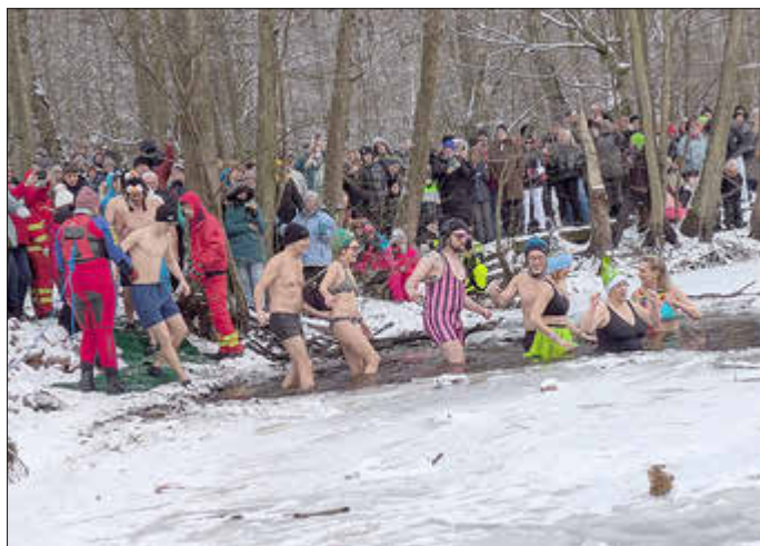
Die erste Gruppe geht steigt in den Eiskanal.