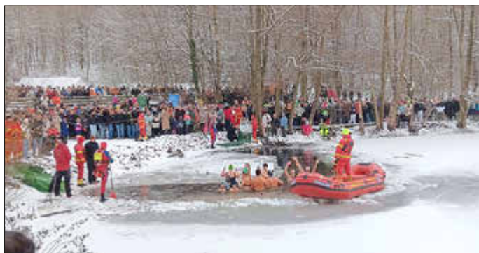
Zahlreiche Zuschauer verfolgen das Treiben vom trockenen Ufer.

Eine geschlossene Eisdecke auf dem Weiher, eine geschlossene Schneedecke rundum und prächtiger Sonnenschein, so war die Situation beim ersten offiziellen Eisschwimmen 2006. Zum zwanzigjährigen Jubiläum gab es zwar nur wenig Sonne, aber dafür nach achtjähriger Pause erstmals wieder Eis und Schnee, also perfekte Bedingungen fürs Eisschwimmen.