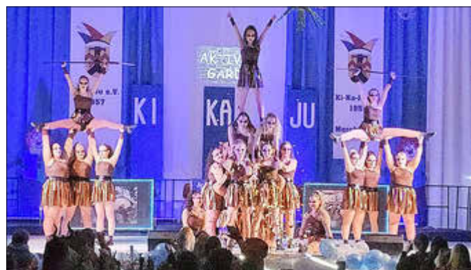
Die Aktivegarde begeisterte mit spektakulären Hebefiguren.