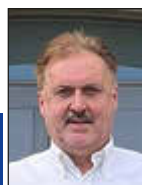
Mitteilungen des Ortsvorstehers OT Merchweiler