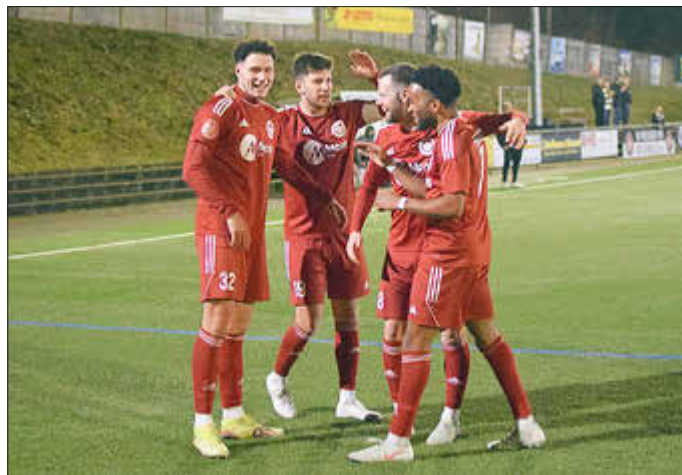
Jubel beim Mittwochsspiel

Mit einer bärenstarken Vorstellung gerade in der zweiten Hälfte gewann unsere Erste am Mittwochabend mit 4:1 gegen den Tabellenvierten. Das war der erste Dreier nach der Winterpause auf dem Haldy - super!