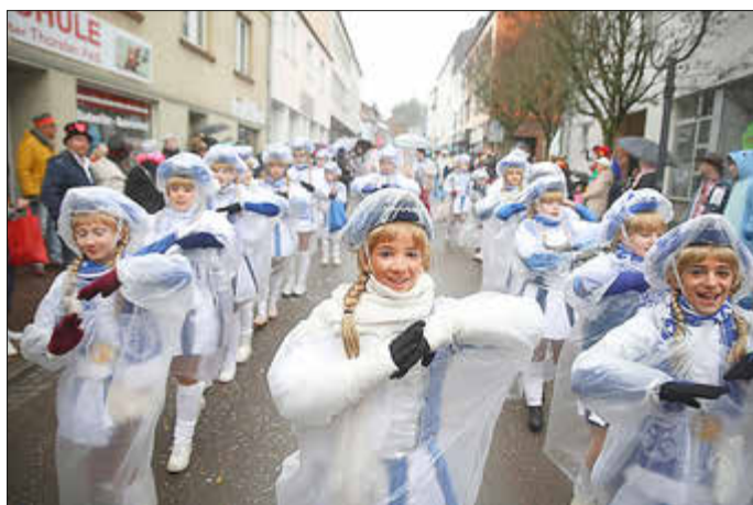
Die Garden der Ki-Ka-Ju waren in Illingen gut verpackt, um die Uniformen gegen den Regen zu schützen.

Am Sonntag gings dann weiter zum Umzug in Wemmetsweiler. Das Wetter war okay und so trat die Ki-Ka-Ju mit ihren Garden und Showtanzgruppen, dem Elferratswagen an. Wer das traditionelle Elfensbusse vom Männerballett vermisste: Die neuen Regeln für Umzugsfahrzeuge haben das Busje aufs Altenteil verdammt, Fun-Fahrzeuge ohne Straßenanmeldung sind nicht mehr erlaubt. Besonderen Spaß verbreiteten Garde und Männerballett, die ihre Tänze immer mal wieder auf der Straße tanzten. Da mussten einfach alle Zuschauer mitkatschen und mitschunkeln. Besonderen Spaß machte wieder das vom Ki-Ka-Ju Techniker Jan Dejon speziell „komponierte“ Ki-Ka-Ju Allright-Lied mit ordentlich Wumms. Danke an die Veranstalter und alle, die für die Sicherheit gesorgt haben. Der Montag in Illingen begann verregnet, trotzdem war die Stimmung gut und viele Zuschauer waren wetterfest verpackt gekommen. Auch hier waren alle Gruppen stark vertreten und brachten eine großartige Stimmung auf die Straße. Kurz vor Ende zauberte Petrus dann noch-