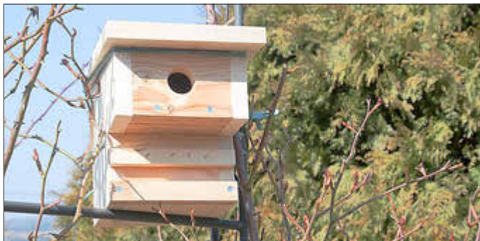
Ein fertig montierter Nistkasten