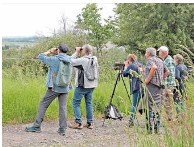
Die Exkursionsteilnehmenden vom letzten Jahr beobachten die Graureiher-Kolonie.

Der NABU Merchweiler-Wemmetsweiler lädt zur Frühjahrswanderung ins Obere Merchtal ein.