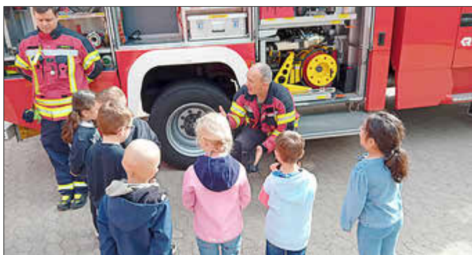
Besichtigung eines Feuerwehrautos