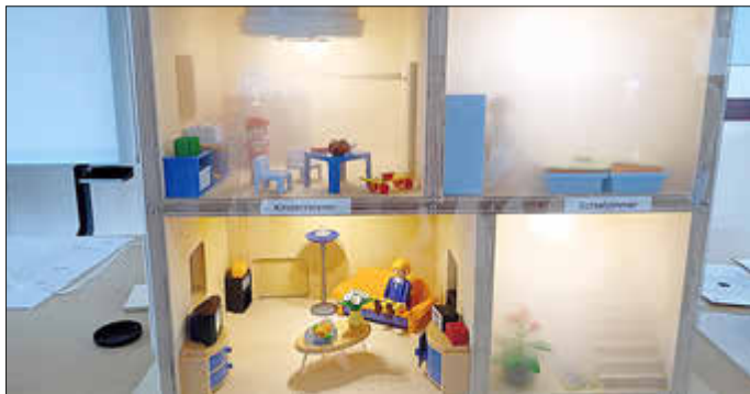
Holzhaus mit Playmobilfiguren