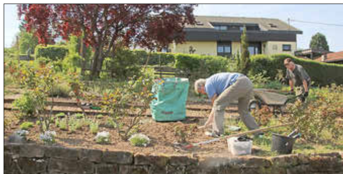
Das neue Beet mit lila Rosen und weißblühenden Begleitkräutern wird hergerichtet.

Am Samstag, 23. Mai, von 9 bis etwa 12:00 Uhr, treffen sich die Beetpaten und -Patinnen des Rosengartens Wemmetsweiler zu einem Arbeitseinsatz. Neben den üblichen Frühjahrsarbeiten ist vorgesehen, rund um den Pavillon die Bepflanzungen zu optimieren und Wege und Pfade aufzufrischen.