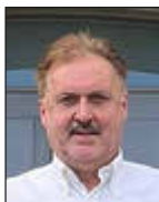
Mitteilungen des Ortsvorstehers OT Merchweiler