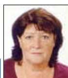
Sprechzeiten der Seniorenbeauftragten