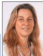
Mitteilungen der Ortsvorsteherin OT Wemmetsweiler