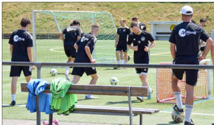
Schwitzen bei starker Hitze

Mittwoch, 08. Juli, 19:00 Uhr, in Fischbach gegen Spvgg Friedrichsthal Freitag, 10. Juli, 19:00 Uhr, in Bübingen gegen Spvgg Halberg-Brebach Montag, 13. Juli, 18:30 Uhr in Erbach gegen Erbach Donnerstag, 16. Juli, 19:30 Uhr in Quierschied gegen Schiffweiler Samstag, 18. Juli, Finalsplele in Quierschied Samstag, 25. Juli, und Mittwoch, 29. Juli: Erste Spieltage Saarlandliga!