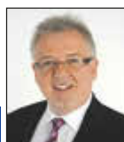
Informationen des Behindertenbeauftragten

Schnell & einfach über Whatsapp 0151 - 16305402 oder unter vertrieb@wittich-foehren.de